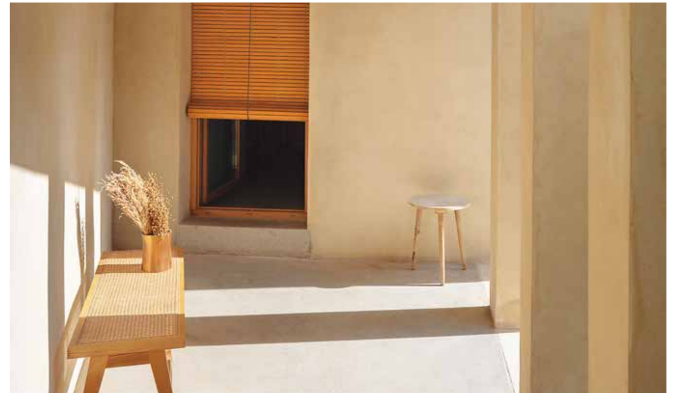
TEXTOS: PAU MONFORT.